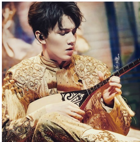
Dimash Kudaibergen dombrán játszik

https://www.youtube.com/watch?v=Z7GZkShQK7s&ab_channel=DimashKudaibergen (1:50)