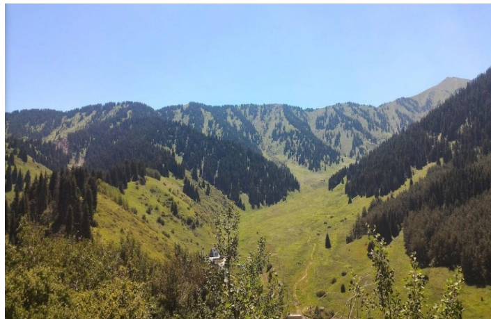
Samal Tau, Kazahsztán

https://www.youtube.com/watch?v=UvMRkiYu3Js&ab_channel=DimashKudaibergen (5:36)