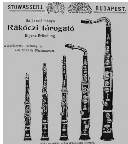
5. ábra: Rákóczi tárogatócsalád

hangszerei (5.ábra) ötletadói lettek hangszerészeinknek is a megújulásra. Schundának csodálatos küllemű és hangú alttárogatóját ismerjük.