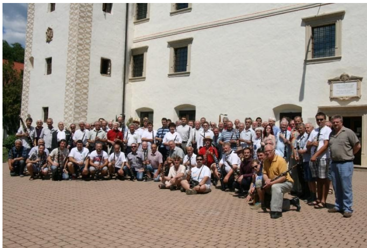
6. ábra: V. Tárogató Világtalálkozó (Vaja, 2015) (Nagy Csaba közlése)

A célok teljesülése érdekében országos találkozokat és ötévente világtalálkozókat szerveznek (6.ábra).