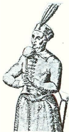
2.ábra: Peter Bertelius metszete (1589)

Előadásaim során gyakran konfrontálódok a tárogató történetével foglalkozó laikusokkal, és olykor szakemberekkel is, hogy a tárogató vajon ősi magyar hangszernek tekinthető-e. Sajnos nem mértékadó, hogy Lajtha László 2 véleményét felhasználva a The New Grove Dictionary of Musical Instruments ősinek írja le 3 . Legkorábbi ábrázolása 1589-ből származik. Bertelius metszetén egy rutén (magyarorosz) katonazenész és hangszerei láthatók 4 (lásd 2. ábra).