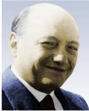
Pető András orvos, nemzetközi hírű mozgásterapeuta