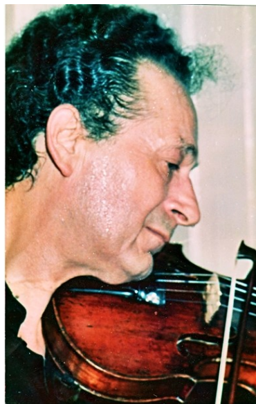
Ruha István (Nagykároly, 1931. augusztus 17. Kolozsvár, 2004. szeptember 28.) hegedűművész, kamarazenesz.

Érdekes véletlen, hogy a valóságban Antonin Ciolan névre hallgató egyik intézményigazgató és karmester a könyvben azonos monogrammal, de Anton Ciorbaként jelenik meg. A hatvanas években, amikor az együttes engedélyt kapott egy kis nemzetközi nyitásra, lehetővé vált Budapesten a magyar-román zenei párbeszéd illusztrálása is: „Az est első felében Bartók Román népi táncok című rövid darabját és Enescu Román rapszódiaját , a második felében Beethoven IX. szimfóniáját.” (Itt jegyzem meg, hogy a Transilvania lemezkiadásainak listáján Beethoven művei hangsúlyosan szerepelnek, ahogyan, már a kezdetektől, az Electrecord indulásától. A lemezcég első, 1963-as felvétel éppen Ruha Istvánnal készült, Paganini Első hegedűverseny -ének szólóját játszotta: