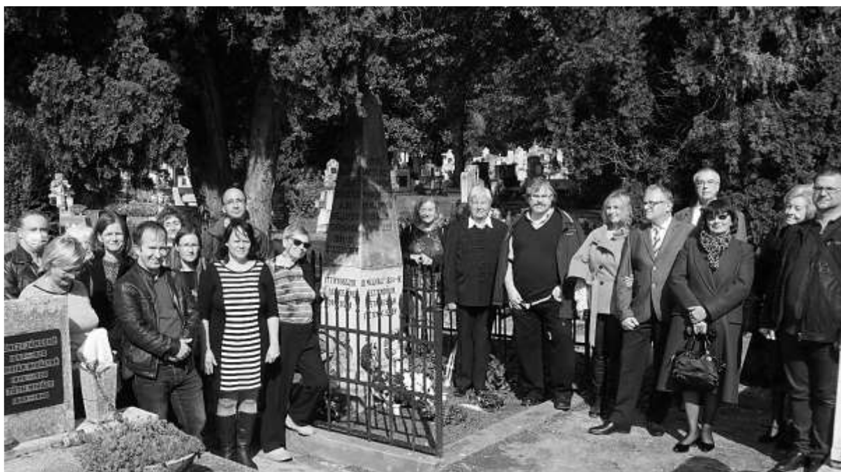
A konferencia résztvevői Lavotta János síremlékénél Tállyán, 2020-ban