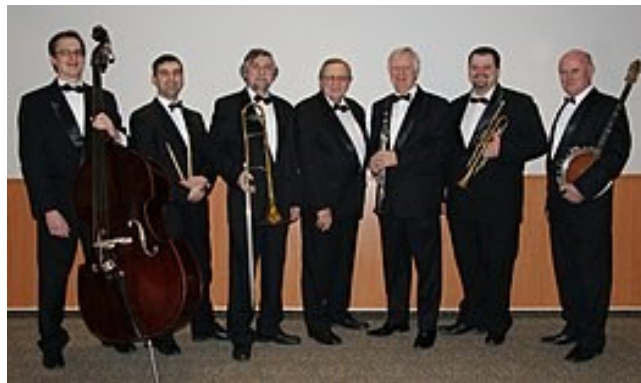
A Benkó Dixieland Band 2010-ben

A közönségkiszolgálás e zenekarnál kart a karba öltve működött a közönségneveléssel. Ennek kezdő fázisa volt a naponta akár több város iskoláiba is ellátogató ifjúsági koncertsorozat, amely már igen korai években jazzre kezdte nevelni a felserdülő leendő közönséget. Így aligha véletlen, hogy a magyarországi jazz-zenekarok közül egyedüliként(!) a Benkó Dixieland Bandnek volt több tízezres(!) adatbázisa. Évtizedekkel a számítógépes világ előtt. Erre az adatbázisra támaszkodva kerültek sorra azután előbb a szuper