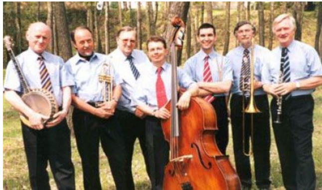
A 30 éves Benkó Dixieland Band hagyományos „Sándor-napi” koncertjére Kaposvárott 1987. március 18-án került sor (zene.hu)

Mi is volt a Benkó Dixieland Band titka? Mindenekelőtt az, hogy a zenekar sohasem „önkifejezésre” törekedett. Náluk a jazzközönség maximális kiszolgálása volt a fő cél. Ennek jegyében a BDB-ben poroszos fegyelem volt. A próbákról esetlegesen elkésők büntetésként komoly summákat fizettek. A koncertek az újabb kori magyarországi jazzkoncertek szokásától eltérően pontosan kezdődtek(!) és igen komoly, feszített, nagyon gondosan megkomponált programot hoztak.