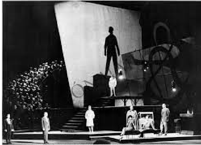
Budapest. A Magyar Állami Operaház díszteréből, Mihály András: „Együtt és egyedül” című operájából. Yll. Magyar Hírlap 1966. november 5.

Jelenet Mihály András: Együtt és egyedül c. operájából, amelynek 1966. november 5-én volt a bemutatója a Magyar Állami Operaházban.