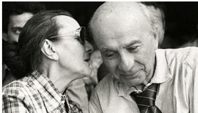
Illyés Gyula feleségével, Kozmutza Flórával 1979-ben

Hát így állok én a híres német tudásommal. A der, die, das-sal, nem vagyok tisztában, de merek beszélni, ha kell kézzel-lábbal rásegítek. Sok külföldi vendég érkezett, idegen nyelvű műsorunk nem volt, így ahogy tudtam elmagyaráztam nekik mindent. Ők ezért duplán hálásak voltak, amit én készséggel elfogadtam. Micsoda vendég névsor: az iráni Sah a kormány-páholyban, felesége a 11.-ben /a feleségek mindig külön ültek/, Tito elnök, az indonéz nagykövet. Arafat kezét is fogott velem. Nálam ült az osztrák kancellár is és ne feledkezzek el Fülöp hercegről sem. A jugoszláv és orosz nagykövettől még puszit is kaptam. A felsorolásból Rákosi Mátyás se maradhat ki. Kádár János mindig nagy kísérettel érkezett a kormánylépcső rejtékén. Hozzá nem juthatott be senki, de a mellékhelyiségbe neki is ki kellett jönnie. Köszöntött és megkérdezte: „Hogy van kedveském?” Ez is jól esett nekem, hiszen ő mégse volt akárki.