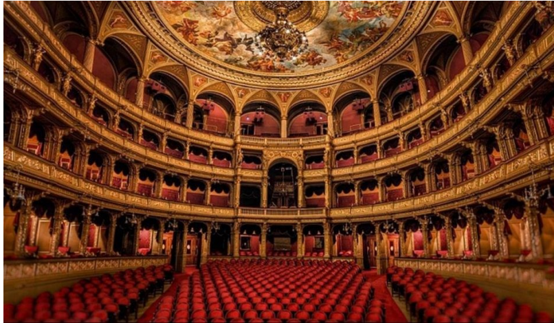
A Magyar Állami Operaház felújítás előtti nézőtere (kultura.hu)

- Az Operaház fontos személyisége, páholynyitogató volt, az első emelet jobb-közép elit során. Királynői alkata, hófehér hajjal keretezett szép arca, megtéveszthette a látogatót. Finom kezét apró ékköves gyűrű díszítette, hosszú ujjait zongoraművészeink megirigyelhették volna.