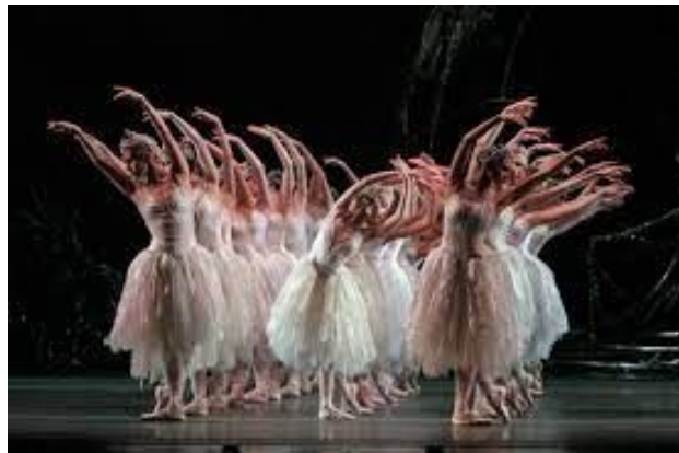
Csajkovszkij: A hattyúk tava (balett.info)

Én egyszerű dolgozó voltam, de adtam a külsőmre, tiszta ruhában, szépen fésült hajjal jelentem meg minden este. Ezt elvártam volna a közönségtől is. Szerettem a gyerek-előadásokat, gyönyörűséggel néztem le a proscénium páholyból, vasárnap délelőtt, olyan volt a nézőtér, mint egy virágos rét: sok színes ruhácska, szalag, csipke, büszkeséggel töltött el. A gyerekeket tanítani kell a szépre-jóra. Én ezt próbáltam egész életemben.