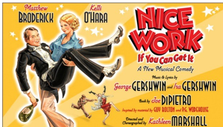
A Gershwin fivérek egyik musical-jének plakátja

Todd Decker második tanulmánya 17 az 1980-as évek közepétől kezdődő jelenségnek, az „új” Gershwin musicaleknek jár utána, mely elsősorban egy igényes színháztörténeti írás, megannyi érdekességgel az amerikai zenés színházi ipar működési mechanizmusairól. Négy musical kerül előtérbe, melyek a Gershwin-musicalesk, valamint az 1920-as és 1930-as évek operettsémáit gondolták újra. A művek az alábbiak: a My One and Only (1983), a Crazy for You (1992), a Nice Work If You Can Get It (2012) és az An American in Paris (2015). Mindegyik alkotás inspirálódott Gershwin filmmusicalesiből, Broadway-darabjaiból, ezek érdekfeszítően pontos elemzését olvashatjuk.