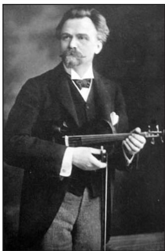
2. Hubay Jenő hegedűművész

Zakatoltak a vonat kerekei... tatamm... tatamm... tatamm... Mindannyian nagy várakozással tekintettek az eljövendő események elé; tudták, hogy ettől a látogatástól megváltozhat az életük. Hogy hová igyekeztek? Hubay Jenő hegedűművészhez, a Királyi Zeneakadémia hegedű tanszak vezetőjéhez, egyben a főiskola főigazgatójához. Az édesanya kereste meg levélben Hubay Jenőt, feltárva előtte gondjukat. A kislányuk meglepő eredményeket ért el hegedűtanulása alatt. Az első év végén már a hatodik fekvésben játszott, de most válságba került, a fejlődésben megrekedt, és tanácsot kérnének tőle. Tatamm... tatamm... tatamm... Lassan halad a vonat, és ők tele vannak kételyekkel... arra kérnek választ – írta a levélben az édesanya –, hogy valóban olyan nagy tehetségnek tartja-e a kislányt, hogy érdemes intenzíven taníttatni, vagy csak ügyes, aki majd más pálya mellett hódol a zene iránti kedvtelésének? Lassan begördül a vonat Budapestre, és ők megérkeznek a Zeneakadémia gyönyörű épületébe.