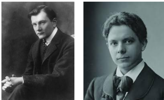
Dohnányi Ernő és Bartók Béla ifjúkori portréja

komponista-palánta volt. A féltékenykedés, ha hihetünk a „fából faragottnak” nem annyira Ernő, mint szülei részéről bizonyult olykor valóságosnak. Bartók Bélának azonban kisebb gondja is nagyobb volt annal, hogy ezzel a korai versenyhelyezettel foglalkozzék, mert: „A Bartók család szűkösen élt, hiszen csak a Mama keresetére (tanítónő volt!) támaszkodhattak. Ahogy teltek az évek, Bartók is pénzkeresővé vált, zongoraoktatást vállalt, és zongorakísérőként is kapott némi fizetséget. igaz, a pénze nagy részét kottákra költötte, hogy újabb és újabb zeneszámokat ismerhessen meg. A fából faragott királyfi szerette volna anyagilag is támogatni Bartókot, de saját keresete nem volt...azt azonban megfogadta, hogy ha királlyá koronázzák, küld majd egy nagyobb összeget a királyi kincstárból az egész család részére.”