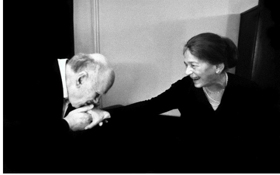
Fischer Annie és Szvjatoszlav Richter