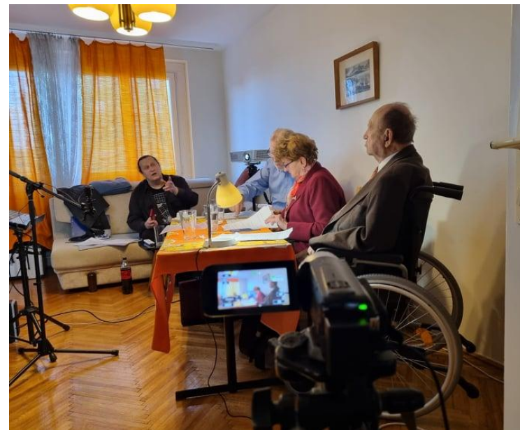
Betekintés a kulisszák mögé