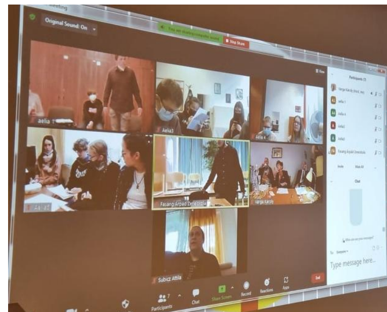
Készülődnek a csapatok