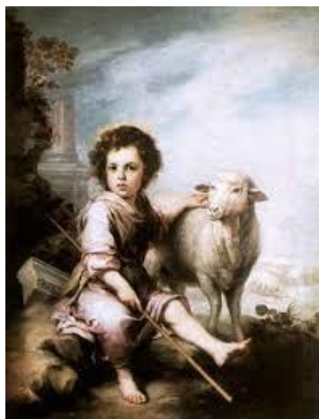
Bartolomé Esteban Murillo: A jó pásztor (Museo Nacional del Prado) |

Lucia Popp - W A Mozart "Il re pastore" - Aminta "L'amerò, sarò costante" (6:17) W. A.Mozart: A pásztor király (Il re pastore) c. operájának a bemutatója 1775. IV. 23-án volt Salzburgban. Aminta II. felvonásbeli „L'amerò, sarò costante” kezdetű áriáját a felvételen Lucia Popp énekli.