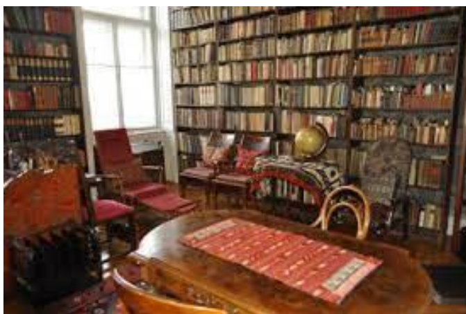
Kodály Zoltán egykori köröndi lakása Emlékmúzeum és Archívum

Egy ízben felvettem, hogy 1948-ban bemutatott, és Balázs Béla librettója miatt megbukott daljátékát, a Cinka Pannát , új és jó szövegkönyvvel fel kellene támasztani. Kodályt foglalkoztatta a gondolat. Egyetértett javaslatommal, hogy Illyés Gyulától kérjünk új szöveget hozzá. Illyés vállalta a számára szokatlan feladatot, két felvonást meg is írt. Tovább, őszinte sajnálatomra, nem jutott (ez a fragmentum 2015-ben jelent meg a Hitel folyóirat hasábjain).