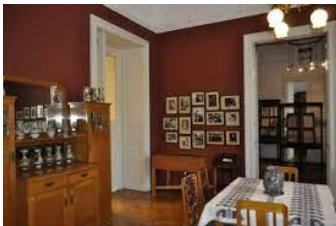
Kodály Zoltán köröndi lakása ma Emlékmúzeum és Archívum

E drámai hangú bevezetőbeszéd után Kodálynak több rádió-előadását szerkeszthettem még, köztük A folklorista Bartók , Szentirmaytól Bartókig , Szóval: kultúr? és Erkel és a népzene címűeket. Más műsoraimat is megtisztelte közreműködésével: bevezetőt mondott a nagy svájci karmestert, Ernest Ansermet -t köszöntő születésnap programhoz, majd a hiteles tanú szavával emlékezett meg az ötvenöt esztendővel azelőtt komponált Bartók-opera, A kékszakállú herceg vára születéséről és bemutatójáról.