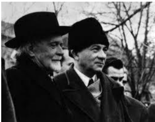
Kodály Zoltán és Illyés Gyula

Egy ízben felvettem, hogy 1948-ban bemutatott, és Balázs Béla librettója miatt megbukott daljátékát, a Cinka Pannát , új és jó szövegkönyvvel fel kellene támasztani. Kodályt foglalkoztatta a gondolat. Egyetértett javaslatommal, hogy Illyés Gyulától kérjünk új szöveget hozzá. Illyés vállalta a számára szokatlan feladatot, két felvonást meg is írt. Tovább, őszinte sajnálatomra, nem jutott (ez a fragmentum 2015-ben jelent meg a Hitel folyóirat hasábjain).