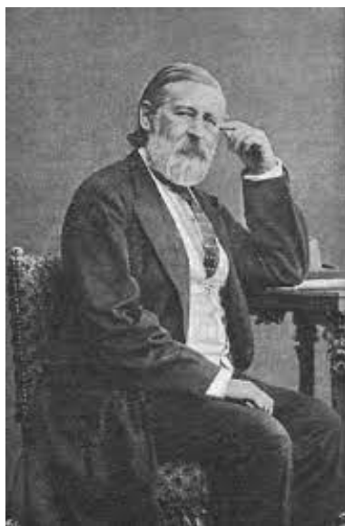
Id. Ábrányi Kornél , születési nevén Eördögh Kornél

(Szentgyörgyábrány, ma Nyírábrány, 1822. október 15. – Budapest, 1903. december 20.) zenei író, szerkesztő, zeneszerző, zongoraművész, zenepedagógus. Névhasználatában 1870 után tűnt fel az 1849-ben született, azonos nevű író fiától való megkülönböztető „id.” szócska.