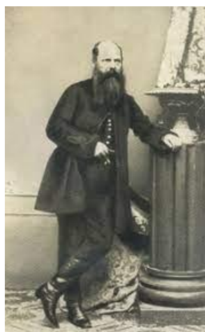
Mosonyi Mihály (1814-1870)