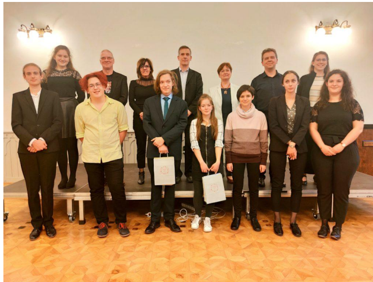
A díjazottak és a zsűri (a második sorban)

A kórus, mint e zenei elképzelések, technikai utasítások megvalósítója is értékelhette egy különdíj erejéig e tehetséges, elhivatott, minden tiszteletet megérdemlő ifjú muzsikusok teljesítményét.