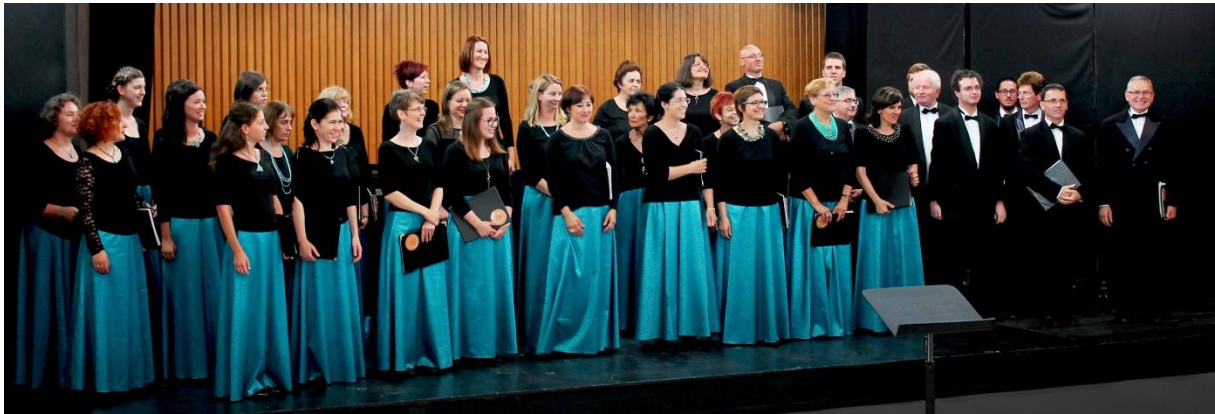
A Budapesti Vándor Kórus

A kórus, mint e zenei elképzelések, technikai utasítások megvalósítója is értékelhette egy különdíj erejéig e tehetséges, elhivatott, minden tiszteletet megérdemlő ifjú muzsikusok teljesítményét.