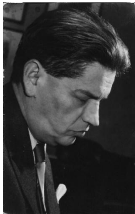
Ungár Imre (1909–1972)