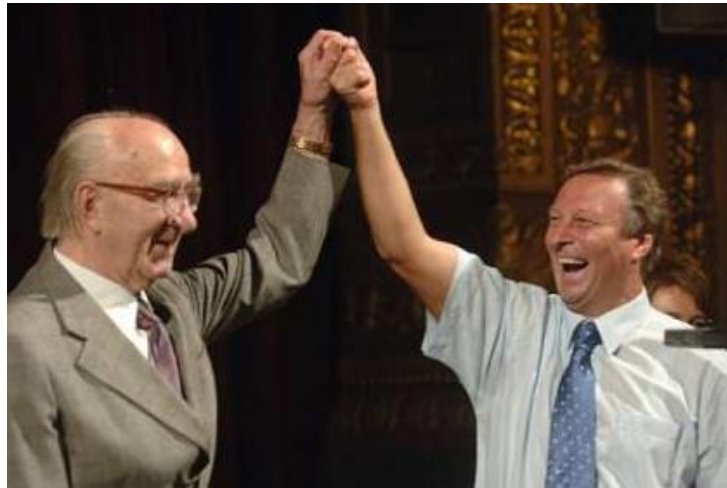
A Melis György-díj átvétele után a díj névadójával (2006)