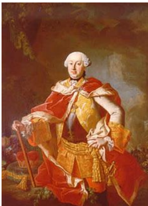
Esterházy Pál Antal