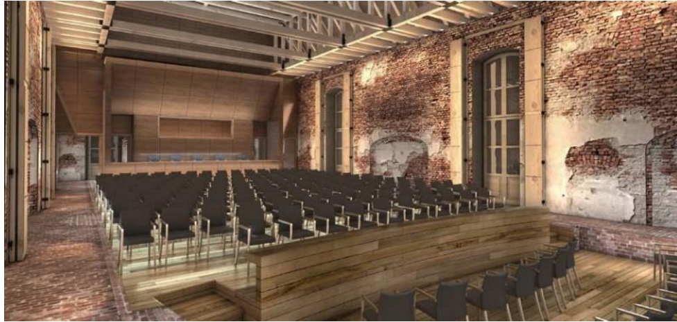
A restaurált Marionett Színház

A túlköltekezést azonban még egy Esterházy-udvar sem tudta anyagilag egyensúlyba hozni, ezért az 1790–1794 között regnáló Antal herceg feloszlatta a zenekart, és nyugdíjba küldte Haydnt.