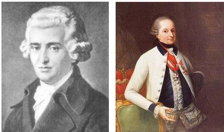
A fiatal Joseph Haydn és Esterházy Fényes Miklós portréja (Martin Knoller festménye)