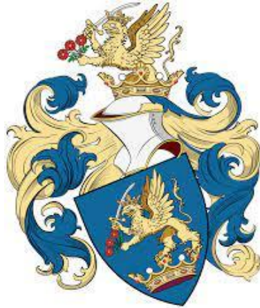
Az Esterházy főnemesi család címere

Az Országos Széchényi Könyvtár Zeneműtára, ennek részeként az Esterházy-gyűjtemény másfél évtizeden át volt vezetőjeként sokszor megálltam az Esterházy kottákat tároló raktári polcok előtt és kerestem a rejtély megoldását. Mi lehetett az oka annak, hogy magyar főurak egymást felváltó nemzedékei, műkedvelő zeneszerető emberek, de mégis csak katonák, diplomaták, azaz civilek, kották beszerzésére szinte egész légiónyi alkalmazottat vettek fel, őket jól megfizették, pedig a beérkező, vagy helyben másolt produktum, az elkészült kotta s nyomában a kottatár, ha nem szólalt meg azonnal, egyáltalán nem volt szépnek mondható. A képtár vagy az ötvösművészeti remek szomszédságában még a híres Esterházy-„zebrák” is (az eszterházaai és a kismartoni operajátékot kiszolgáló kék-sárga csíkozású tékába kötött állományrészek) – megszólaltatásuk nélkül – csak szerény, reprezentációra alkalmatlan látványt nyújthattak.