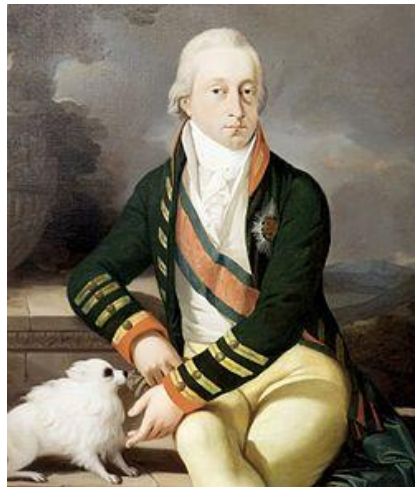
Esterházy II. Miklós

A túlköltekezést azonban még egy Esterházy-udvar sem tudta anyagilag egyensúlyba hozni, ezért az 1790–1794 között regnáló Antal herceg feloszlatta a zenekart, és nyugdíjba küldte Haydnt.