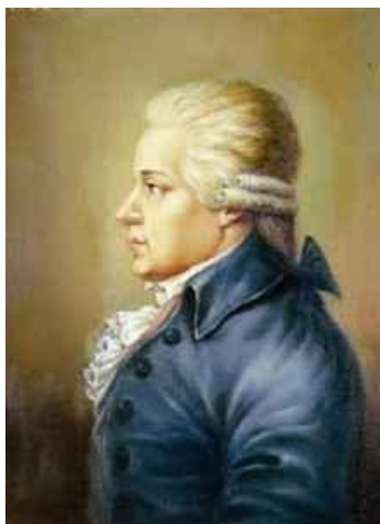
D. von Dittersdorf