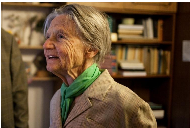
Legányné Hegyi Erzsébet

ZENEPEDAGÓGUS, EGYETEMI TANÁR (Nagykanizsa, 1927. november 4. – 2017. január 24.)