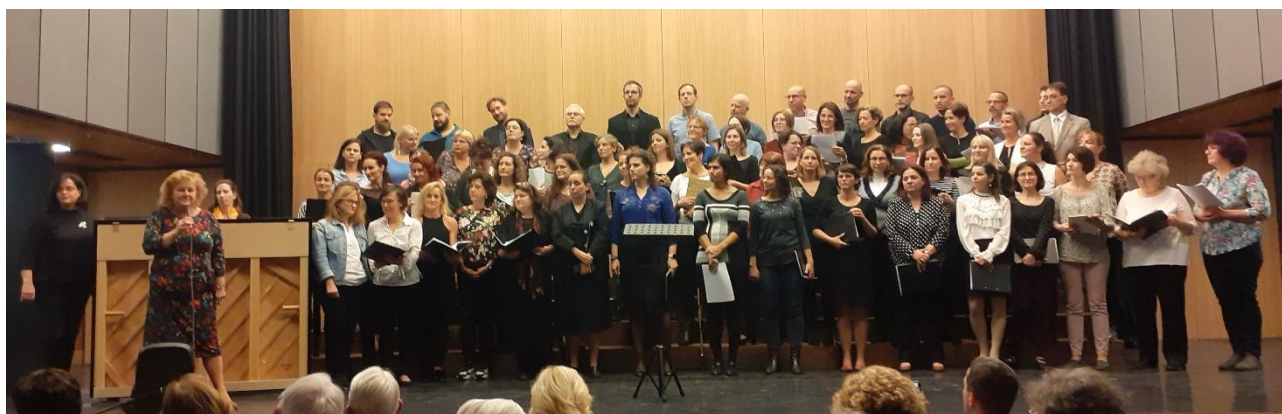
Az Ifjú Zenebarátok ünnepi kórusa.