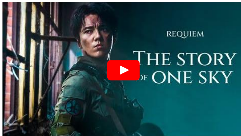
A békéért kiált a The Story of One Sky című, 3 évig érlelt szerzeményével is, amit a Világ- és Hagyományos Vallások Vezetőinek VII. Kongresszusa Egység a sokféleségben című koncertjén mutatott be (2022.09.13.; HU) 9

Csendes, de kiterjedt jótékonyági tevékenységet folytat; hazájában – de annak határain túl is – több segélyszervet mögé beállt. Egyes koncertjei bevételének egy részét szintén humanitárius célokra fordította, fordítja. 10