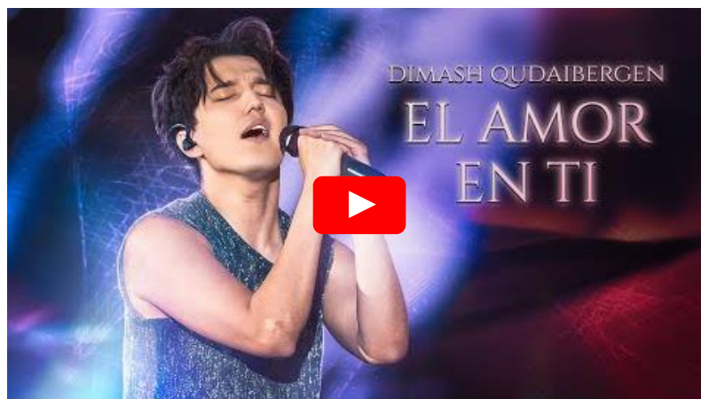
Az almati koncertjén bemutatott Benned a szeretet (El amor en ti; 2022.09.23. HU)

Nem ő az egyetlen, aki az éteri hangjával azt csinál, amit akar: hol lágyan simogató, de ha kell, erőteljes, hogy a földhöz vág; hol fátyolos, máskor kristály tisztán csengő. Képes másodpercek alatt bejárni a tartományát pincétől a padlásig, akár könnyedén, botlás nélkül ugrándozva is.