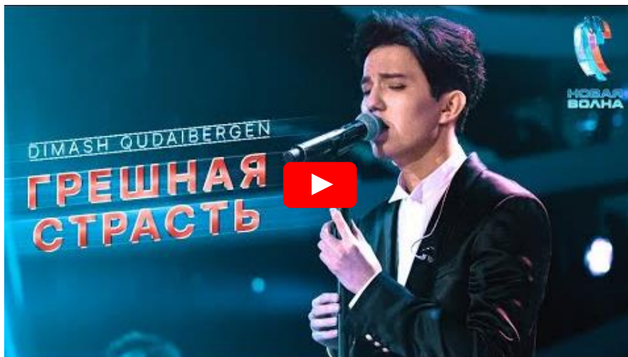
Bűnös szenvedély (Грешная страсть / Sinful Passion) ( szövege )

Műfaji sokszínűsége a poptól, rocktól a népzeneig, a raptól az operáig terjed, amit nem ártall akár egy-egy dalán belül is mesterien kombinálni, és ezáltal akár egy közepszerű dalból is gyöngyszemet kerekíteni: