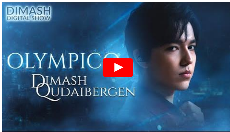
A 2019-es Európai játékok megnyitóján bemutatott Kövek ereje (Ogni Pietra / Olympico HU)

Nem ő az egyetlen, akinek a hangtartománya lelóg a zongoráról, meghaladja a 7 oktávot. Nem ő az egyetlen, aki képes férfiként és nőként is, kettő – vagy akár több – az egyben is énekelni.