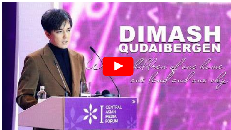
A béke melletti beszéde a Közép-Ázsiai Média Fórumon (CAMF; 2022.12.20.; HU)