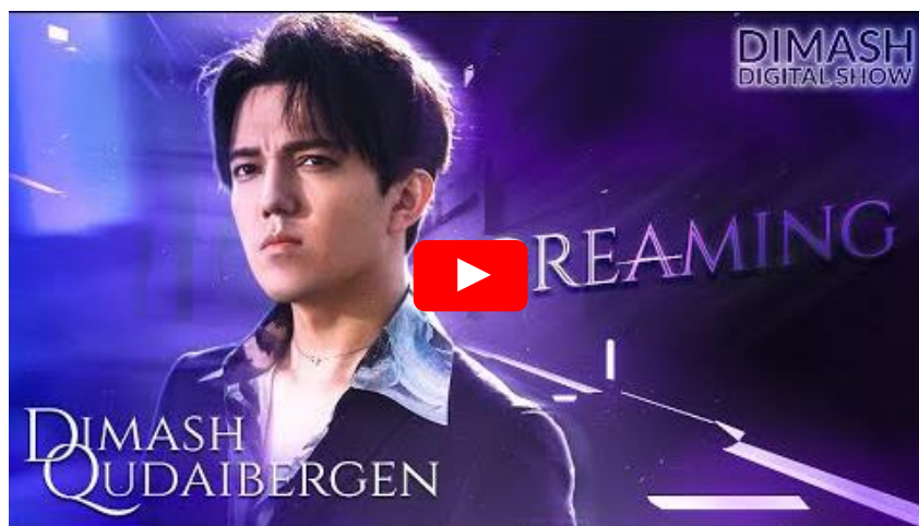
Sikítás (Screaming) – kazak rap-betéttel a Digital Show c. online koncertjéből (HU)