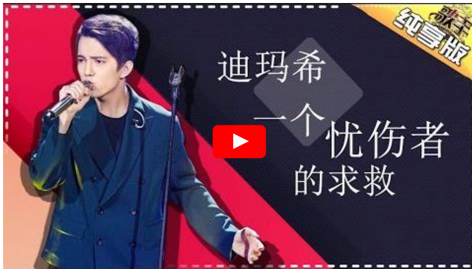
Az azóta névjegyévé vált S.O.S. a Starmaniából – a Singer 2017 első fordulójában ( szövege vagy HU 2 )

2017. január 21-ről 22-re virradó éjszaka fölrobbant a kínai közösségi oldal, a Weibo. Este került adásba a Hunan tévé profi énekeseknek ötödik éve megrendezett I am Singer versenyshow azévi első fordulója. Az első, legfiatalabb résztvevő, a 14 közül egyetlen, első ízben nem kínai, egy 22 éves kazak fiatalember... tarolt. Előadásával a forduló összes szavazatának 27 %-át besöpörte, és másnap reggelre 300 ezer, estére 600 ezer rajongója lett a Weibon, a kínaiak pedig rövid időn belül már "importált kistestvérüknek" nevezték.