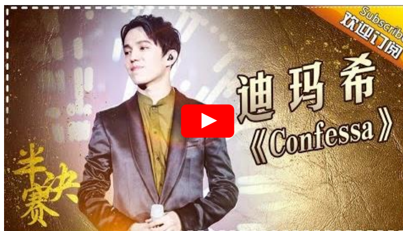
A Diva tánca (Diva Dance) 11 a Fifth Element ből – a Singer 2017 középdöntőjében (3:11-től)

Nem ő az egyetlen, aki az éteri hangjával azt csinál, amit akar: hol lágyan simogató, de ha kell, erőteljes, hogy a földhöz vág; hol fátyolos, máskor kristály tisztán csengő. Képes másodpercek alatt bejárni a tartományát pincétől a padlásig, akár könnyedén, botlás nélkül ugrándozva is.