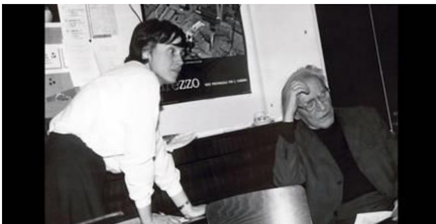
Bárdos Lajos a Budapesti Monteverdi Kórus próbáján (1986.04.16.)