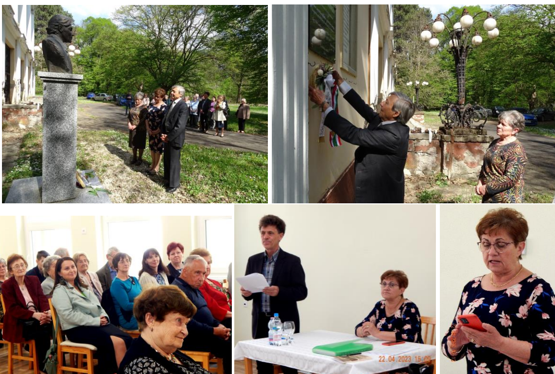
A délutáni program a Békés-tarhosi Zenebarátok Körének éves közgyűlésével folytatódott (képeink).

A szakmai program résztvevőit ebéddel látták vendégül a házigazdák, majd a csodásan gondozott parkban történelmi sétán vehettek részt a jelenlévők. A Gulyás Györgyről elnevezett Zenepavilonnál megkoszorúzták az Énekiskola alapítójának mellsobrát és a Kodály-emléktáblát, s az egykori diákokkal együtt népdalénekléssel tisztelegtek a neves karnagypedagógus emléke előtt.