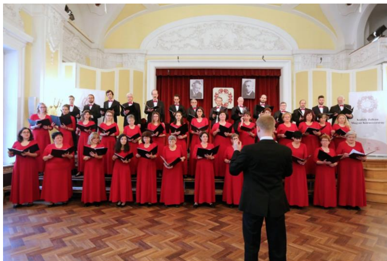
Vasas Művészegyüttes Vass Lajos Kórusa – 2022.

A Vasas Művészegyüttes Vass Lajos Kórusának elérhetősége: