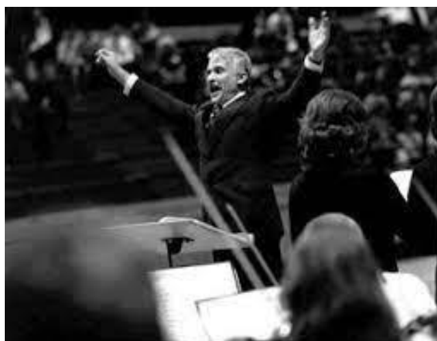
Vass Lajos (1927–1992) karnagy, zeneszerző a Vasas Központi Művészegyüttes énekkarát vezényli a Vasas Szakszervezet centenáriuma alkalmából a miskolci Sportcsarnokban rendezett ünnepi hangversenyen.