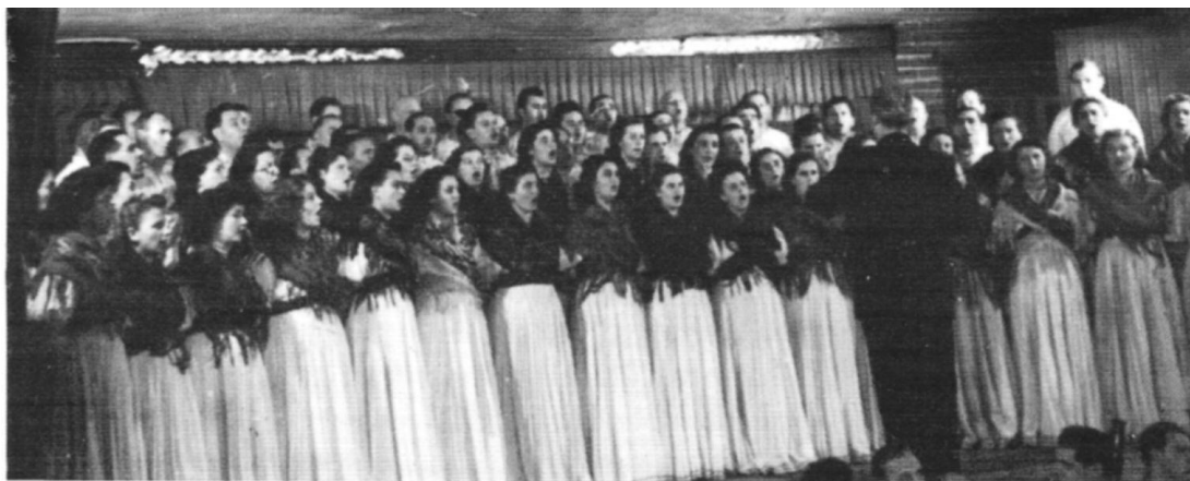
Az énekkar népviseletben Dunaújvároson (Sztálinváros), 1951-ben