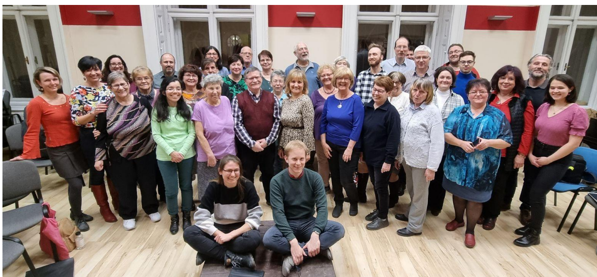
A Vass Lajos Kórus Vegyeskar fotója az együttes Facebook-ján