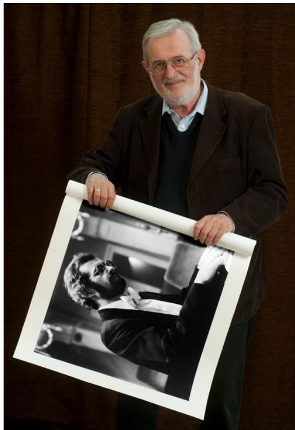
Jandó Jenő 1983-ban és 2013-ban