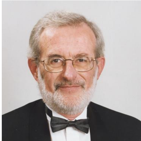
Jandó Jenő (1952–2023)