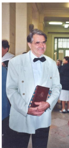
A Gyémántoklevél átvételekor (2003)