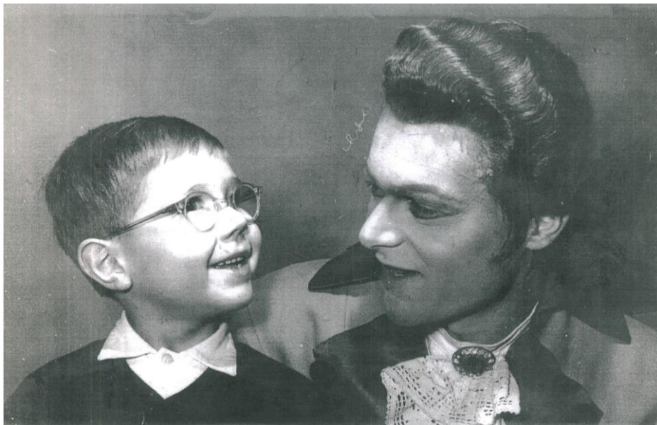
Almaviva gróf jelmezében, az előadás után, kisfiával

Zeneakadémiai vizsgakoncertje pont aznap volt, amikor elkezdte a Kelenföldi Lakótelep alapútjainak tervezését. A Skála és a későbbi Alle épületének építése újabb felfedezések felé mozdította örökmozgó természetét: a bontás és építkezés folyamatát négy évig filmezte hetedik emeleti lakásából. A későbbiekben már elismert, hiánypótló dokumentumfilmet készített ebből az anyagból, „Újjáalkotás” címen. Ugyanitt a munkálatok idején futballbíróként is tevékenykedett. Kutató alkata nyilvánvalóvá tette, hogy ezután a játékvezetés elméletéről is írjon egy tanulmányt. Mint mérnök, osztályával harminc évig tervezte Budapest legnagyobb közlekedési létesítményeit, legjelentősebbek egyike a Budaörsi úti autópálya bevezetése. Itt olyan módszert alkotott, amelyet a szakma átvett, a szerző több, mint húsz évig tanította a szakmérnök hallgatóknak, mint meghívott előadó. A Fővárosi Művelődési Ház Operaegyüttesének tagjaként harmadmagával létre hozta a Budai Opera Együttest , melyet 2004-ben újjá szervezett Bel Canto néven.