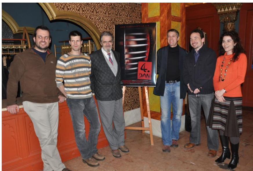
A „4. dan” c. film premierjén az Uránia moziban. A rendező George Perrin a képen jobbról a második.

A Magyar Zenei Tanács tagjaként működő Alkotó Muzsikusok Társaságának megbecsült tagja volt, festményeivel, írásaival és hangjával is emelte a társaság színvonalát. Jellegzetes, finom baritonját Hajdu Lóránt és Szánthó Lajos zeneszerzők kísérték almalmanként szintetizátoron, zongorán.