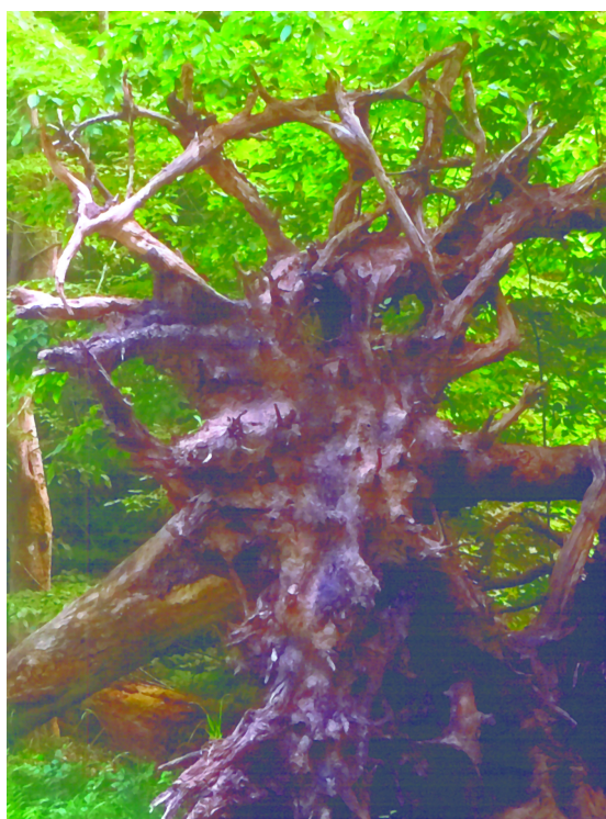
Töviskorona (69.o., Az én miniatűr zenetörténetem fejezetnél)