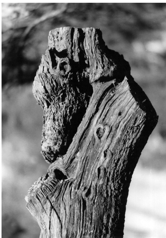
Kékszakállú (51.o., Az én miniatűr zenetörténetem fejezetnél)