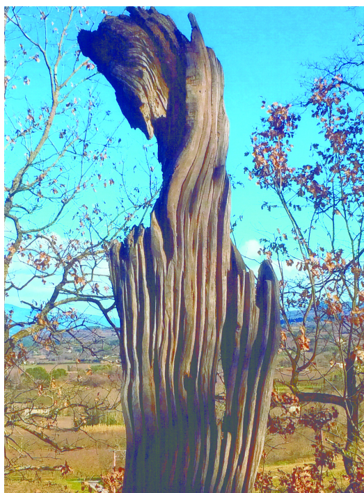
Próféta (111.o., A XX. század francia oboa zenéje fejezetnél)