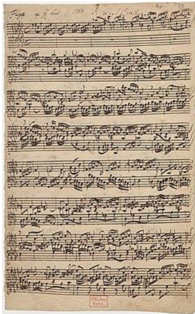
Asz-dúr fúga részlete a londoni autográfban

Inspirációforrás. Azonban valószínűleg mindnyájan, akik pódiumon vagyunk, éltünk meg már úgynevezett „rossz” közönséget is, amelyik kifejezetten nyomasztó. Ez alatt azt értem, hogy hideg, nem nyitott, nem befogadó. Szerencsére nagyon ritkán, egész pályafutásom alatt mindössze 2-3 alkalommal tapasztaltam ezt meg, kizárólag távolabbi külföldi helyszíneken. Egyébként, ha kilépek a pódiumra, rögtön érzem, mire számíthatok.