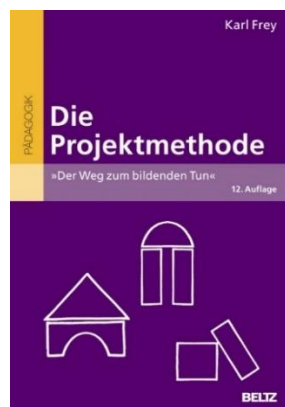
2. sz. ábra A projekt módszer – Karl Frey könyve (2012)