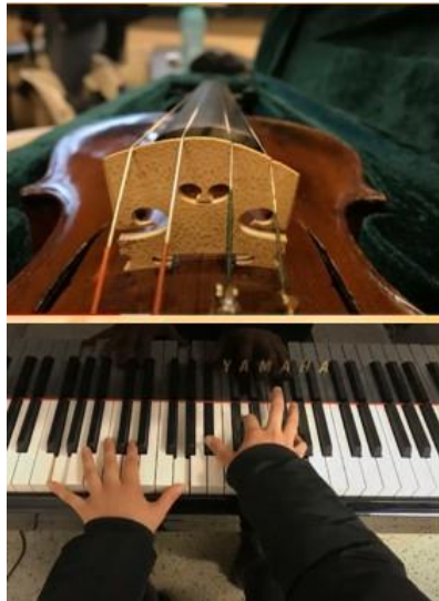
3. sz. ábra Hangszerek a „Minden-Kor zene” projektben

A második projekt esetében már jóval gördülékenyebben alakult a kezdeti lépések megtétele, mivel az első félév sikeres munkáját követően a hallgatók várták a következő félévben a projektmunka újbóli lehetőségét. Így a tervezés és a feladatkörök beosztása sokkal rutinosabban valósult meg, továbbá az előző projekt sikerességének hozadékaként a hallgatók újabb ötletekkel gazdagították elképzeléseiket. E projekt célja a zeneirodalom széles palettájából válogatva minél több élőzenei szóló- és kamara bemutatóval az adott művek minél sokoldalúbb megközelítése és érzelmi átélése lett. A hallgatók javaslatára a zeneművek és létrejövő produkciók körét bővítettük. Így került be a záró programba például egy Disney rajzfilmzenéken alapuló és egy magyar rajzfilmzenéket bemutató hallgatói produkció is.