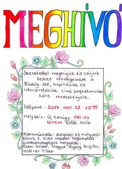
6. sz. ábra: A projektzáró esemény meghívója (Kodály 135 projekt, hallgatói munka)

A munkák összegzésének és lezárásának fő eseménye minden alkalommal egy projektzáró rendezvény volt, mely közül három az egyetem nyilvánossága előtt zajlott, a publikum aktív bevonásával (pl.: közös éneklés, vetélkedő) 2 , egy pedig a Gyakorló Óvoda tornatermében.