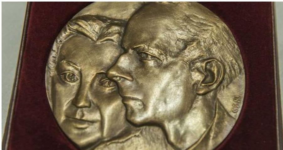
A Bartók Béla - Pásztory Ditta-díj plakettje.