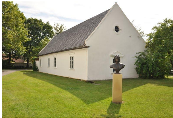
Doborján – Liszt Ferenc szülőháza

Ábrányi rövid, másfél oldalas általános bevezetésében már az első mondatokban feltűnik, hogy egy olyan nagy művész működését és jelentőségét akarja a félszázados jubileum alkalmából „ecsetelni”, azaz a festészet, grafika eszközeit is mintegy „foltszerűen” alkalmazva érzékeltetni, akinek „már életében kijutott a halhatatlanság babérkoszorúja”.