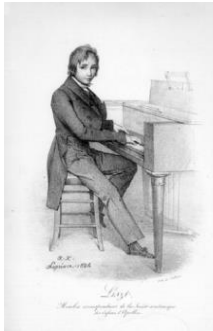
Liszt Ferenc 1824-ben

Beethoven meglátogatása alkalmával hallott szavak, amikor a Mester a szívére kötötte, hogy „a művészet nagy horderejű ügyét soha el ne válassza az emberiség szent érdekeitől.” Mintha egy Mester és tanítvány közötti valóságos beavatási szertartás aprólékos részleteit hallanánk. „Liszt még a mai nap is szent áhitattal emlékezik ama jelenetre, hol mint 11 éves gyermek szemtől szemben állott a legnagyobb zenészeti géniusszal, ki valaha e világra született.” – írja.