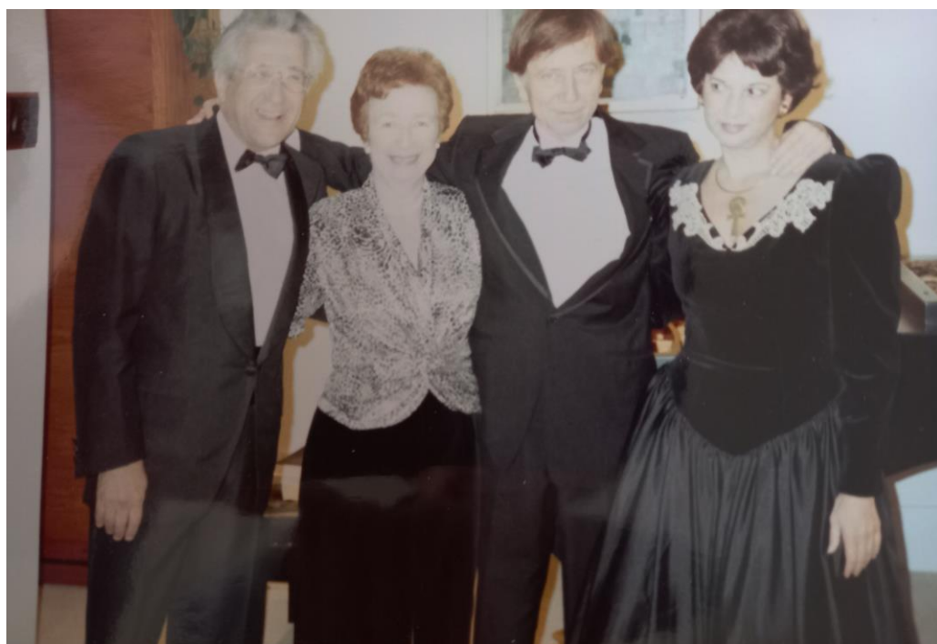
Solti György 80. születésnapja előtt, feleségeinkkel, a londoni Buckingham palotában, 1992-ben.