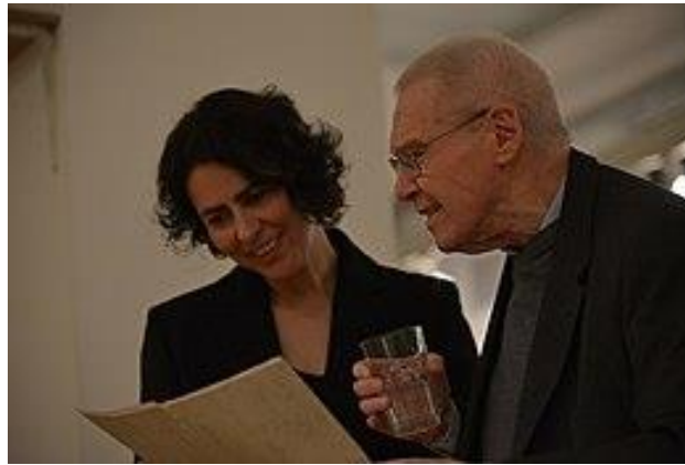
Rajk Judit és Kurtág György

magába, a kormány az ősszel felfüggesztette. A hosszútávra tervezés ilyen körülmények között lehetetlen. Ebben a kiszolgáltatott helyzetben szerencsére még mindig vannak kollégák, akik végtelenül lelkiismeretesen, a legmagasabb színvonalon végzik munkájukat, nélkülük már összedőlt volna az intézmény, ami ne feledjük, az ország egyik legfontosabb, legnagyobb presztízsű felsőoktatási intézménye, Magyarország egyetlen Zeneakadémiája. Ha van Hungaricum, akkor ez az. 150 év munkája, Liszt, Bartók, Kodály és tanítványaik öröksége. A felelősséget nem lehet csak a mi vállunkra tenni.