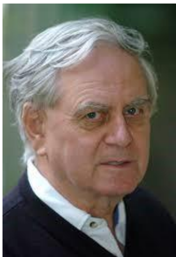
Dobszay László (1935 – 2011) zenetörténész, népzene kutató, karnagy, egyetemi tanár

„Pulchritudo est splendor veritatis” „A szépség az igazság felragyogása”