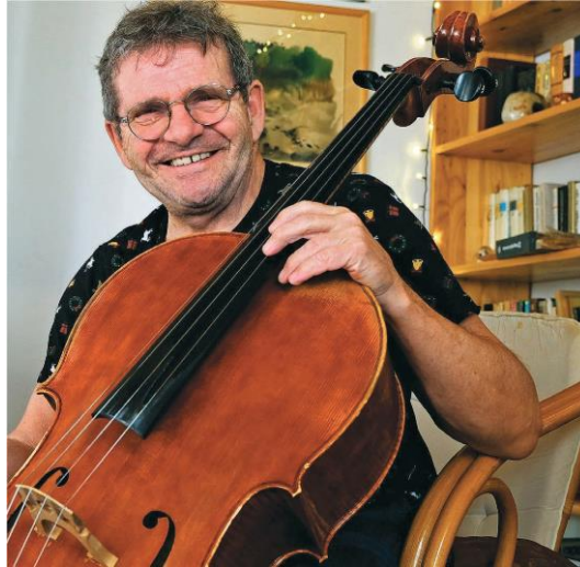
Markó György csellóművész

– Rendkívül ambiciózus volt. Oly mértékben szívén viselte a sorsomat, hogy gyakran járt hozzánk a lakásra is órákat tartani. Ellátott tanulnivalóval, lekötötte minden energiámat. Biztatott, segített, vitt előre a pályán. A 60-as évek elején átment Győrbe tanítani, és felmerült mindjárt, hogy kövessem őt. Némi családi tanakodás után e mellett döntöttünk. Így jártam aztán át hetente többször Győrbe. Majdnem ötven kilométer vonattal. Egy óra húsz perc volt a menetidő oda, majd este vissza.