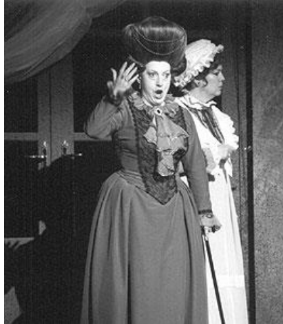
A Grófnő (Csajkovszkij: A Pikk Dáma)

– Szép, hosszú pálya, hiszen még a pandémia előtt is premierben vett részt, Aachenben A pikk dáma Grófnőjét énekelte.