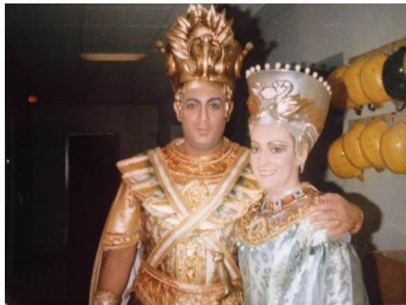
Amneris és Radames (Verdi: Aida)

– S ettől kezdve gyakori vendégként léptem fel a teátrumban. Mindig is büszke voltam a pályám során arra, hogy sosem egy felkérést kaptam, hanem rendszeresen visszahívtak a dalszínházakba. A müncheni teátrum 1981-ben szerződtetett, úgy lettem állandó tag, hogy egy szezonban 12 alkalommal kellett fellépnem, az enyémekek voltak azok a 'gálaelőadások', amelyekbe rangos vendégek érkeztek, közben pedig jártam a világot. A felkérésekben fontos szerepet játszott, hogy a hangom elég egyedi, olyan a hangszínem, amelyet fel lehet ismerni. Emellett érezni a benne rejlő szenvedélyt. S aki egyszer is látta valamelyik alakításomat, biztos, hogy megőrizte az emlékét. Az opera szubjektív műfaj, rengeteg mindenben múlik, hogy ki és hogyan hat a publikumra. Van, aki tökéletesen énekel, de teljesen jellegtelenül. Az ilyen előadók engem teljesen hidegen hagynak. Egyszer Domingo azt mondta nekem: „Ha ne adj Isten egyszer elvesztenéd ezt a gyönyörű hangod, színésznőként is megélhetnél az egész világon.”