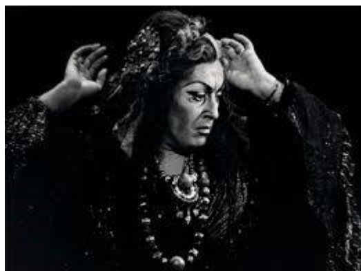
Azucena szerepében (Verdi: A trubadúr)

– Nagyon jó volt ez az időszak arra, hogy megtanuljam, ha egy próba 10-kor kezdődik, akkor bizony pontosan ott van mindenki, tökéletes szereptudással, és minden produkció megfelelő gyakorlást követően kerül pódiumra. Színpadi rutint kaptam, de jelentős különbséget nem tapasztaltam az ottani és a hazai munkarendben.