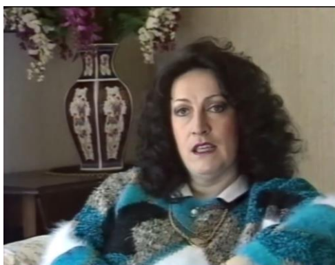
Budai Livia – Portré film (1995) 47:56 (A Magyar Televízió filmje)