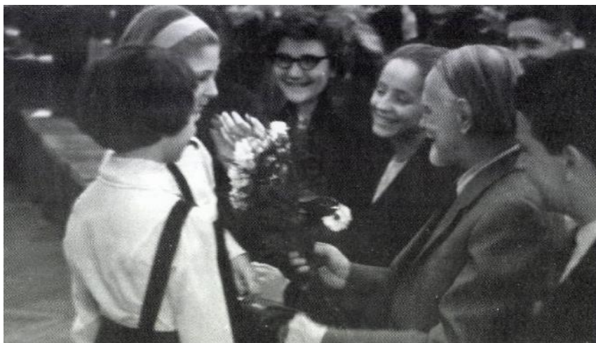
A budapesti Hunyadi János ének-zene tagozatos általános iskola évzáró koncertjén köszöntik a diákok Kodály Zoltánt

2006-ban, az iskola 50 éves jubileumi hangversenyére 80 olyan diákom jelentkezett, akiket 30-40 évvel ezelőtt tanítottam. Közöttük voltak az egykori osztályom tanulói is. Felejthetetlen élmény volt velük újra együtt muzsikálni!