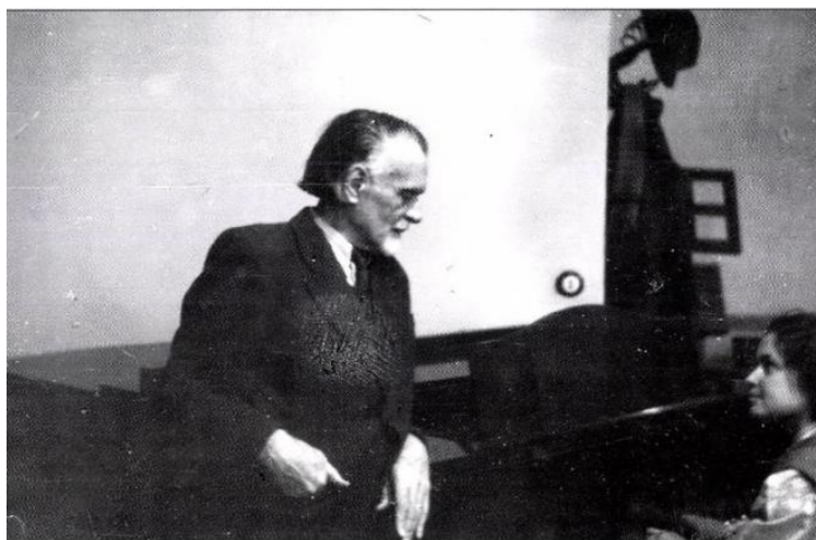
Szolfézsórán a szerző Kodállal a Zeneakadémián, 1954

Az avatás után a búcsúzásnál azt mondta nekem Kodály: „Ősszel találkozunk a Zeneakadémián!” Kimondhatatlanul boldog voltam. 1953 szeptemberétől a Zeneakadémia Zenetudományi Népzene Tanszakának első éves hallgatója lettem. Örömeimet csak az árnyékolta be, hogy ősszel rossz hírek érkeztek Tarhosról: veszélyben az iskola! Kodály mindent megtett érte, de ő sem tudta megmenteni. 1954-ben egy miniszteri rendelettel megszüntették, a növendékeket szélnek eresztették.