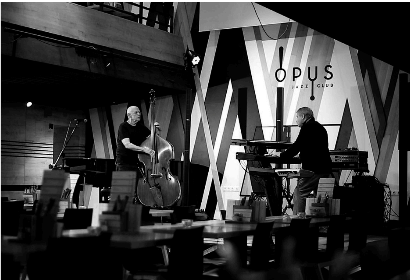
BARRE PHILLIPS, IFJ. KURTÁG GYÖRGY