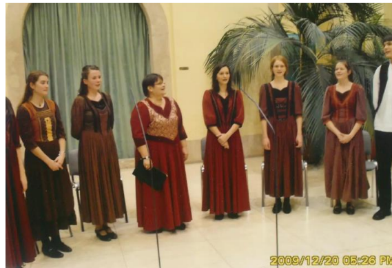
Fellépés a Vikár Béla Népdalkörrel (2009. 12.20.)

Első önálló népdalestjét Nagy László nyitotta meg, egy neki ajánlott versével, 1976-ban. Két évre rá jelent meg első önálló nagylemeze Élő népzene címmel. Ugyanebben az évben alakult budapesti fiatalokból a Vikár Béla Népdalkör , amelynek alakulása óta vezetője volt. Generációk kerültek ki ebből a csoportból, akik a népdalok szeretetét vitték és adták tovább.