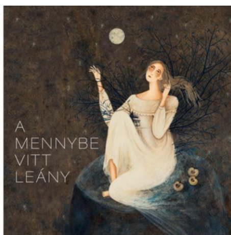
Teljes lejátszási lista megtekintése (9 felvétel)