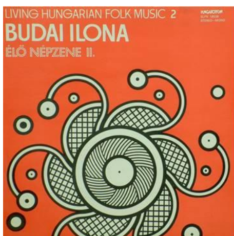
TELJES LEJÁTSZÁSI LISTA MEGTEKINTÉSE (32 felvétel)