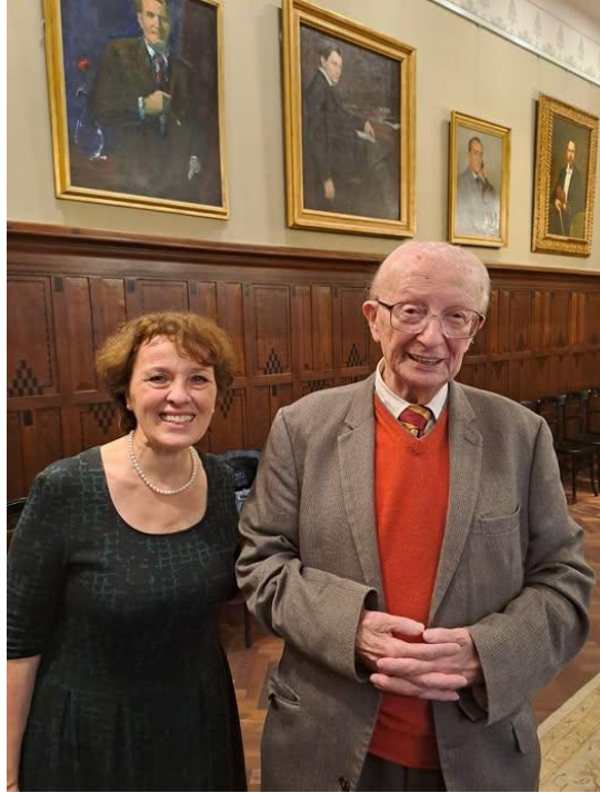
Földes Imre a 90. születésnapja tiszteletére rendezett ünnepségen Solymosi-Tari Emőkével a Zeneakadémia rektori tanácstermében (2024. március 12.)

Neked, de teljeskörűen ezt biztosan nem lehet leírni. Idén márciusban, a 92. születésnapodon a kórházban ünnepeltünk Téged. Két napra rá megint bementem Hozzád. Amikor elköszöntünk egymástól, és elindultam, az ajtóból még visszanéztem. Te is figyeltél engem, integettél, mosolyogtál. Őrzöm magamban ezt a szeretetteljes pillantást. Látod, egyvalamit mégsem tanítottál meg: azt, hogy hogyan legyünk mi itt Nélküled. Sokan fogunk odaképzelné a Zeneakadémia tanári páholyának első sorába, ahogyan álladat letámasztva, teljes odaadással figyeled a zenét. Most már az égi muzsikát hallgatod, és finom humoroddal azokkal a nagy szellemekkel társalogsz, akiket Általad ismerhettünk és szerethettünk meg.