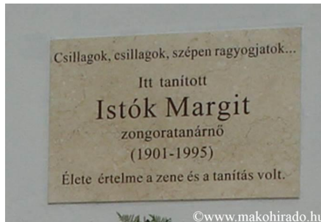
Emléktábla egykori munkahelyének, a makói Bartók iskolának a falán

viszont hangszeres muzsikussá leszek, minden bizonnyal jó emlékezetembe vészi zenetanárait, de közülük is az elsőt, vagy azt, akitől valami nagyon fontosat, szépet, emlékeztetőt, megőrzendő értéket kaptam.