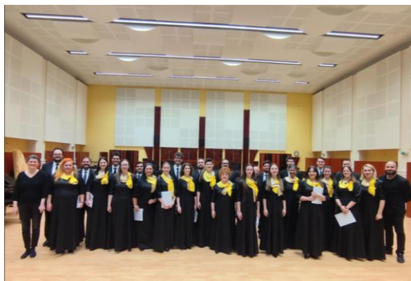
A Szegedi Nemzeti Színház Kórusa.

Mi történik, ha egy végtelenített, tökéletes áriát nem egyetlen énekes, hanem egy egész énekkar énekel, egyetlen gigantikus tüdőként lélegezve? A hatás éteri, és pontosan ez a bel canto egyik lényege: a technika mögött rejlő lélek.”