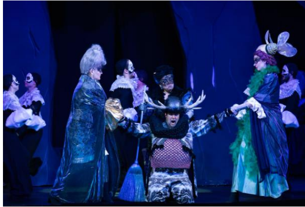
Jelenet a Falstaff III. felvonásból