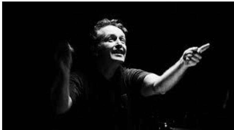
Carlos Kleiber Teljes lejátszási lista megtekintése (70 felvétel)

A meghívni tervezett karmestereket prioritási sorrendbe állítottuk. A listának mindig volt egy melléklete néhány névvel, akiket minőségük a lista élére predesztinált volna, de magunk is tudtuk, kár próbálkozni, úgysem fognak eljönni. A reménytelenek között is a legreménytelenebb Carlos Kleiber volt.