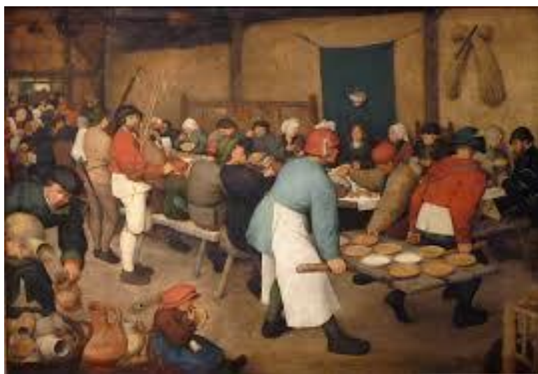
Ifj. Pieter Brueghel: Parasztlakodalom

pl. a kép bal alsó oldalán bort önt valaki- csobbanás hangja, felfedezhető egy duda is stb.