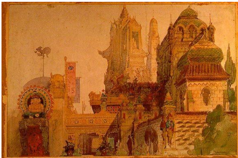
Victor Hartman: Ódon várkastély

Találjanak ki egy titokzatos történetet a zenéhez!