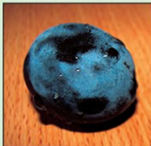
Viaszos héjú termés Mi a jelentősége a viaszos bevonatnak?

Fás szárú növény. Törzse alacsony vagy közép magas, kérge sima, sötétszürke színű, ágai sűrűn állnak, felfelé növekednek. Lombkoronája metszés nélkül felfelé törekvő.