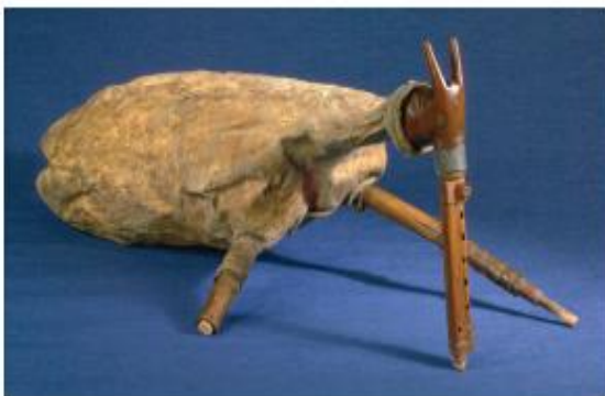
Magyar népi duda