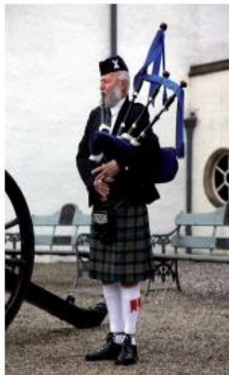
Más népeknél is népszerű hangszer a duda – skót dudás

Kedvem lenne táncolni, a homlokom ráncolni.