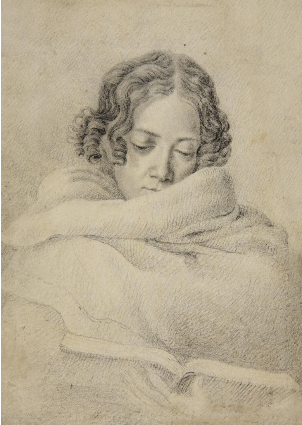
2. Ludwig Emil Grimm: Bettine Brentano 1809. (Goethehaus Frankfurt)