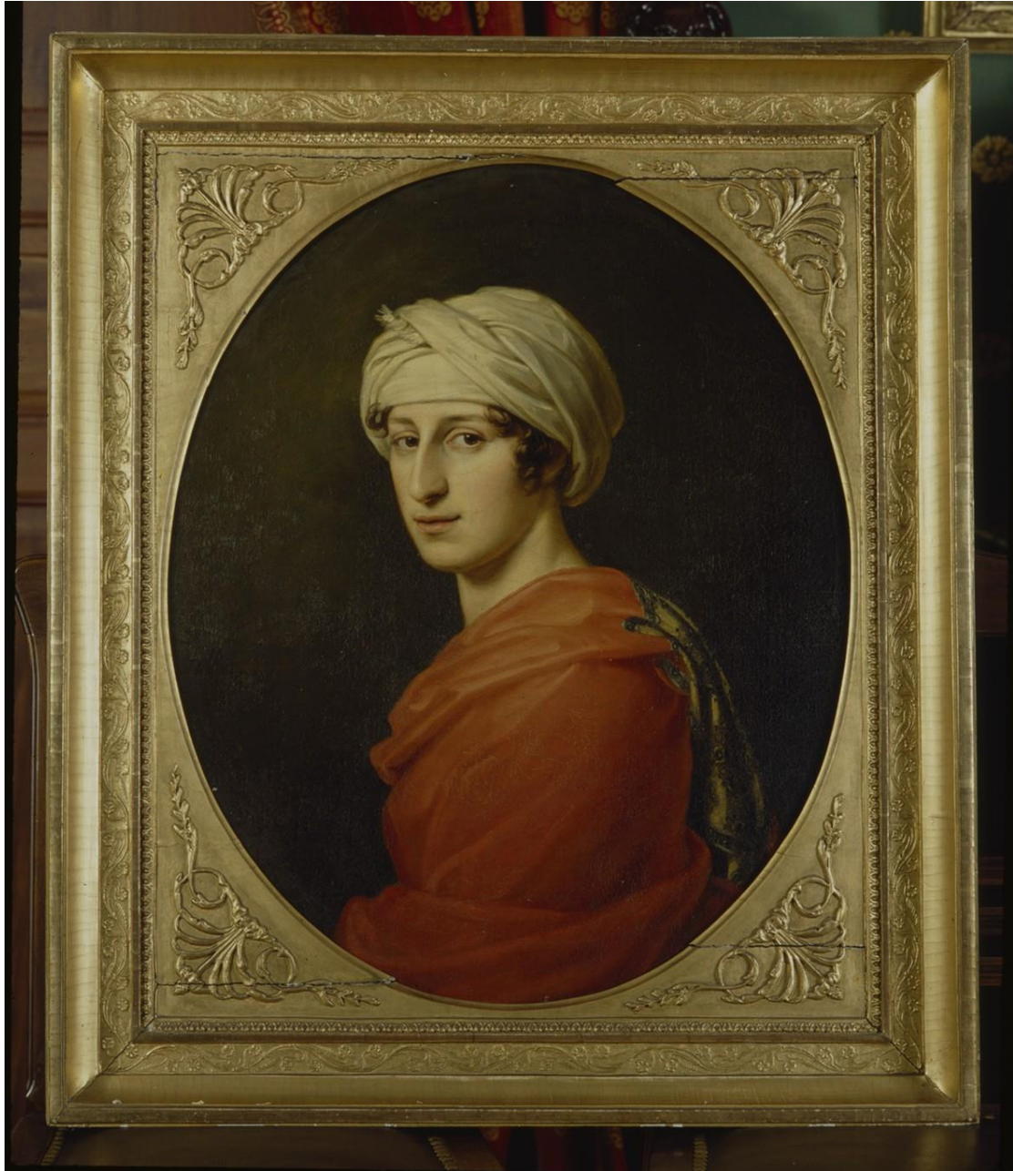
1. Joseph Stieler. Antonie Brentano 1808. (Freies Deutsches Hochstift, Brentano-Haus, Oestrich-Winkel)