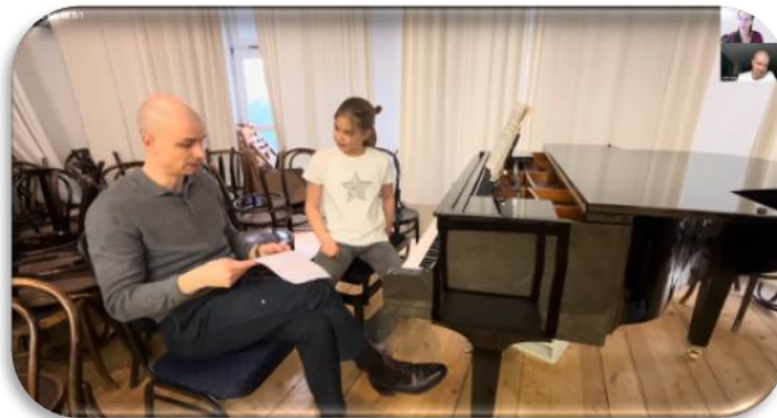
1. kép: Nyitóképek az 1. felvételtől és alatta az 1. visszajelzésből