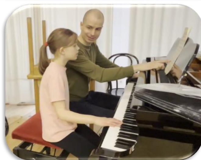
3.sz. kép: Részletek a 4. felvételtől