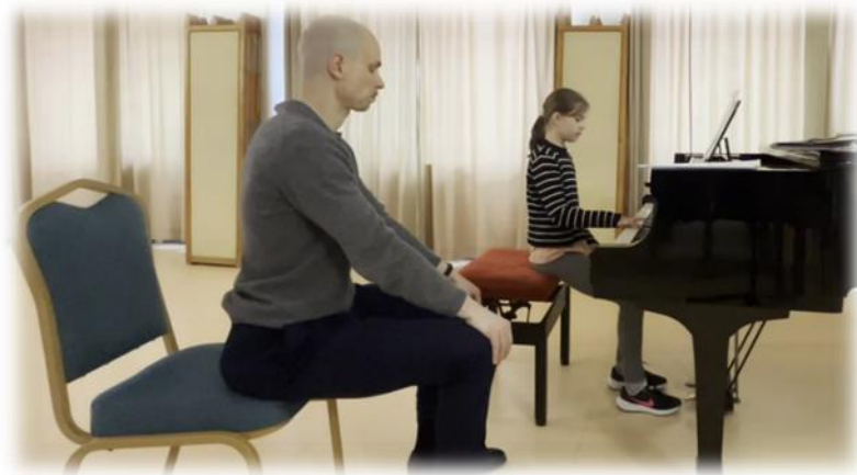
2.sz. kép: Feszült pillanat

b) általában mi minden segíthet stresszhelyzetben, c) ezek közül Hédinél mit alkalmazna.