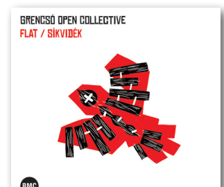
BMCCD205 Grencsó Open Collective Flat / Síkvidék

Hazai forgalmazó: MG Records mgrecords.hu