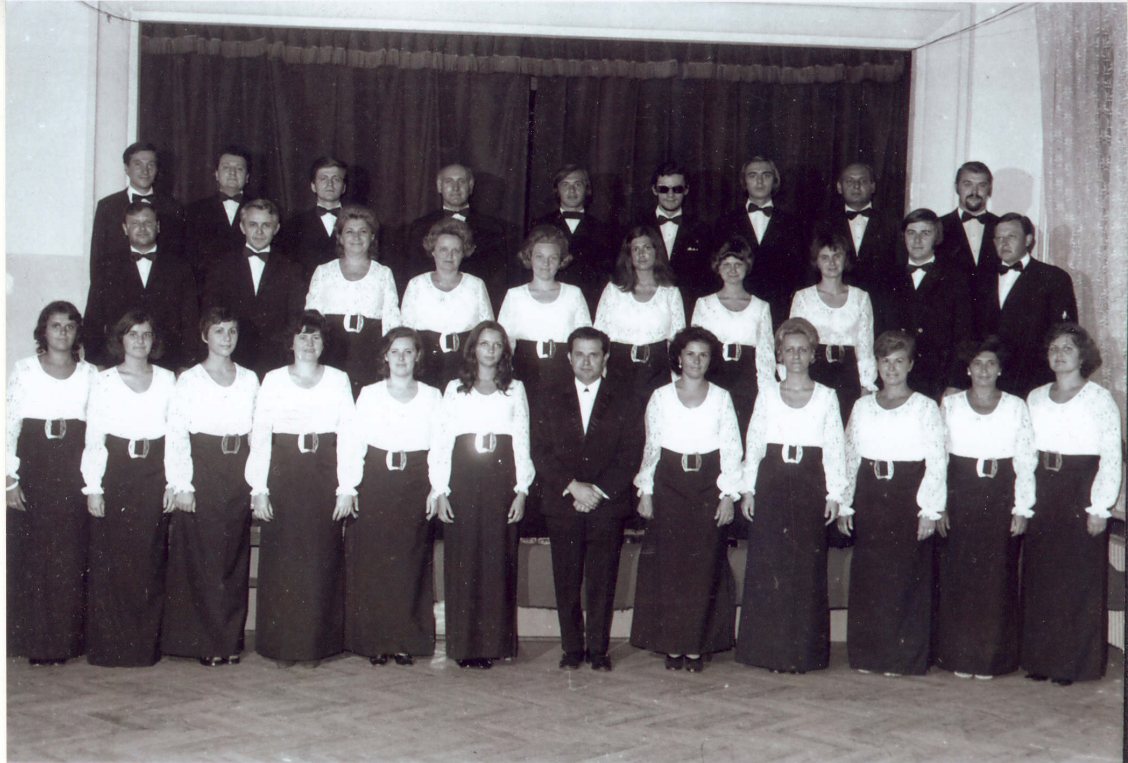
A Bartók Béla Kórus élén 1973-ban