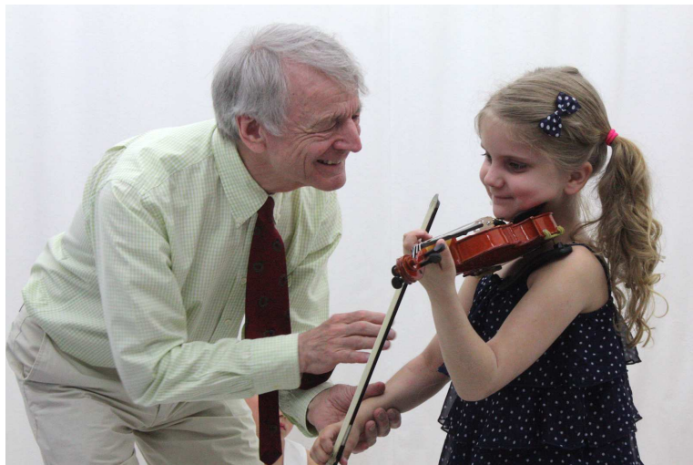
Szilvay Géza tanít ( hankofestival.fi )

A gyermekszoba vagy óvoda zenei meséinek gyermekdallamai a hangszeriskolában változatlanul jelennek meg. Rögzítésük, a kottaírás színesen tárul a gyermek elé. E színes hangjegyek fokozzák és fenntartják az érdeklődést és maradandóvá mélyítik azt. A hangszeriskola minden fejezete mindég csupán egyetlen technikai, teóriai újdonságot mutat be és azt gyakoroltatja. A hangszer alapfokú tanításának történetében eddig még nem használt, több-ujjas balkéz pizzicato, az úgynevezett számozott pizzicato készíti elő a billentést. A tiszta billentés bebiztosítására, vagyis az intonálásra szintén tanítástechnikai újdonság, a természetes üveghangok rendszeres használata szolgál. A könnyű ritmusú gyermekdalok először vonalrendszer nélkül, majd egy- és két vonalrendszerben íródnak. Az ötvonalas rendszert fokozatosan vezetjük be. A kottaolvasás a hangszeroktatás szerves része.